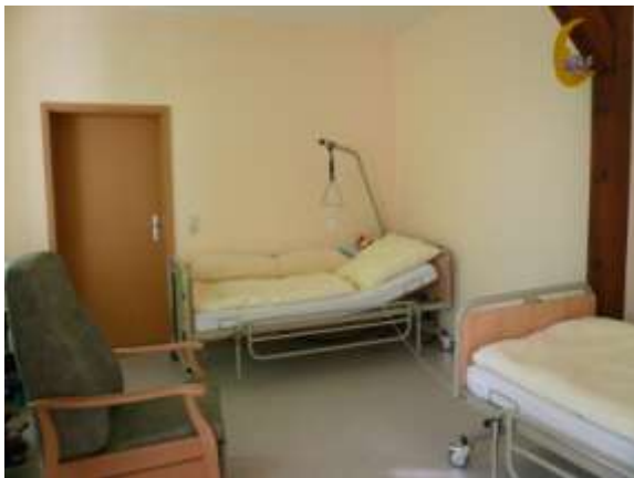
Einer unserer 5 Ruheräume

Ein eigenes Fahrzeug und Fahrzeuge der Johanniter Unfallhilfe, die das bequeme Ein- und Aussteigen ermöglichen, holen die Pflegebedürftigen von Zuhause ab und bringen sie auch wieder zurück. Ein Transport für Rollstuhlfahrer kann ebenso ermöglicht werden.